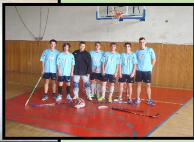
Florbalový zápas v KNM